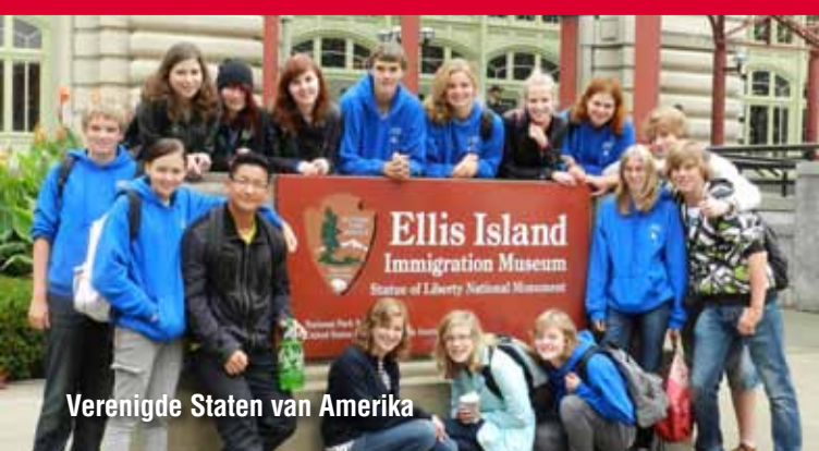
Verenigde Staten van Amerika